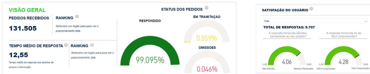
Figura 01 – Painel LAI – Governo Federal

adequado de atendimento. Nesse indicador, o Serpro obteve o 134º lugar dentre 324 órgãos e entidades federais. Quanto à satisfação do usuário, os indicadores encontram-se superiores ao da Administração Pública Federal, apesar do pequeno número de respondentes, indicando bons resultados em relação à resposta fornecida atender plenamente o pedido e ter sido de fácil compreensão.