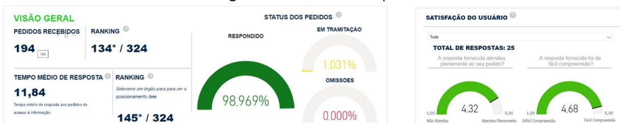
Figura 02 – Painel LAI – Serpro

* Os dados do painel mostram a situação atual (acumulada) e não refletem a seleção do filtro por período (01/01/2023 a 31/12/2023).