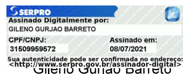
Presidente da Assembleia Geral