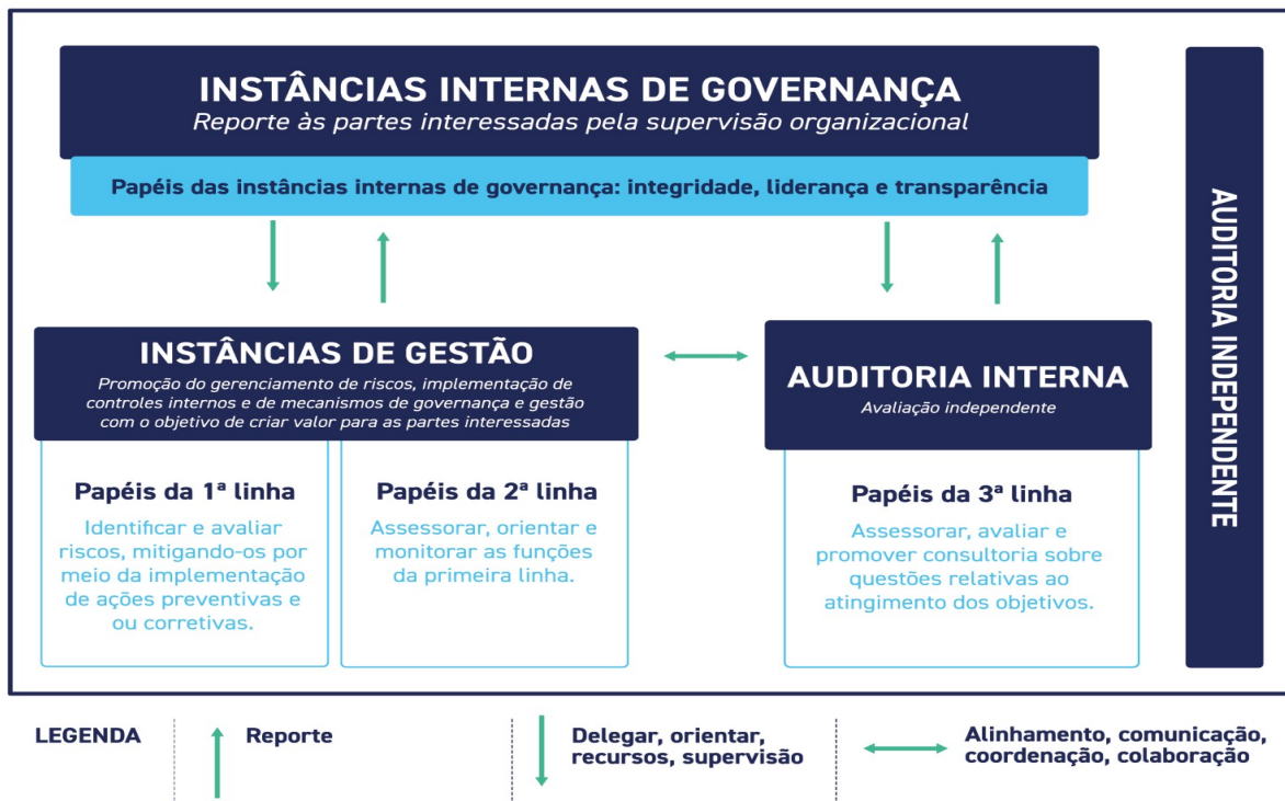
Figura 3 – O modelo das Três Linhas no Serpro

Cada uma das três linhas do Serpro desempenha um importante papel dentro do processo de governança e gestão corporativas a saber: