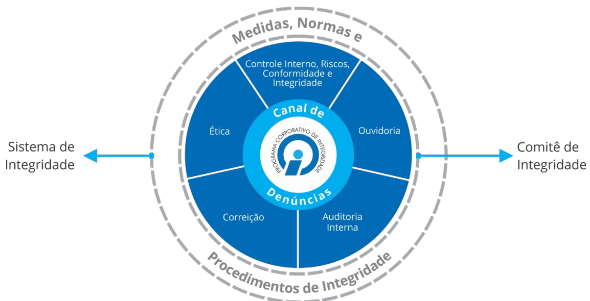
Figura 4 – Sistema de Integridade do Serpro

Nessa linha, foi estruturado o Sistema de Integridade do Serpro que representa um conjunto articulado de mecanismos e procedimentos de integridade implementados pelas diversas áreas da Empresa e pelas Instâncias de Integridade que visam prevenir, detectar, punir e remediar a ocorrência de irregularidades, fraudes, corrupção e desvios éticos que possam vir a ocorrer no âmbito do Serpro, conforme demonstrado na Figura 4.