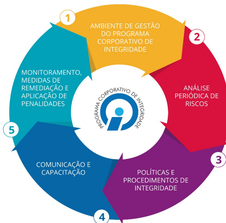
Figura 2 – Dimensões do Programa Corporativo de Integridade (CGU, 2015) 6

De modo a assegurar que os mecanismos e os procedimentos de integridade alcancem toda a empresa e contribuam para o fomento e a manutenção de uma cultura de integridade no ambiente organizacional, o PCINT está estruturado nas 5 (cinco) dimensões, conforme demonstrado na Figura 2: